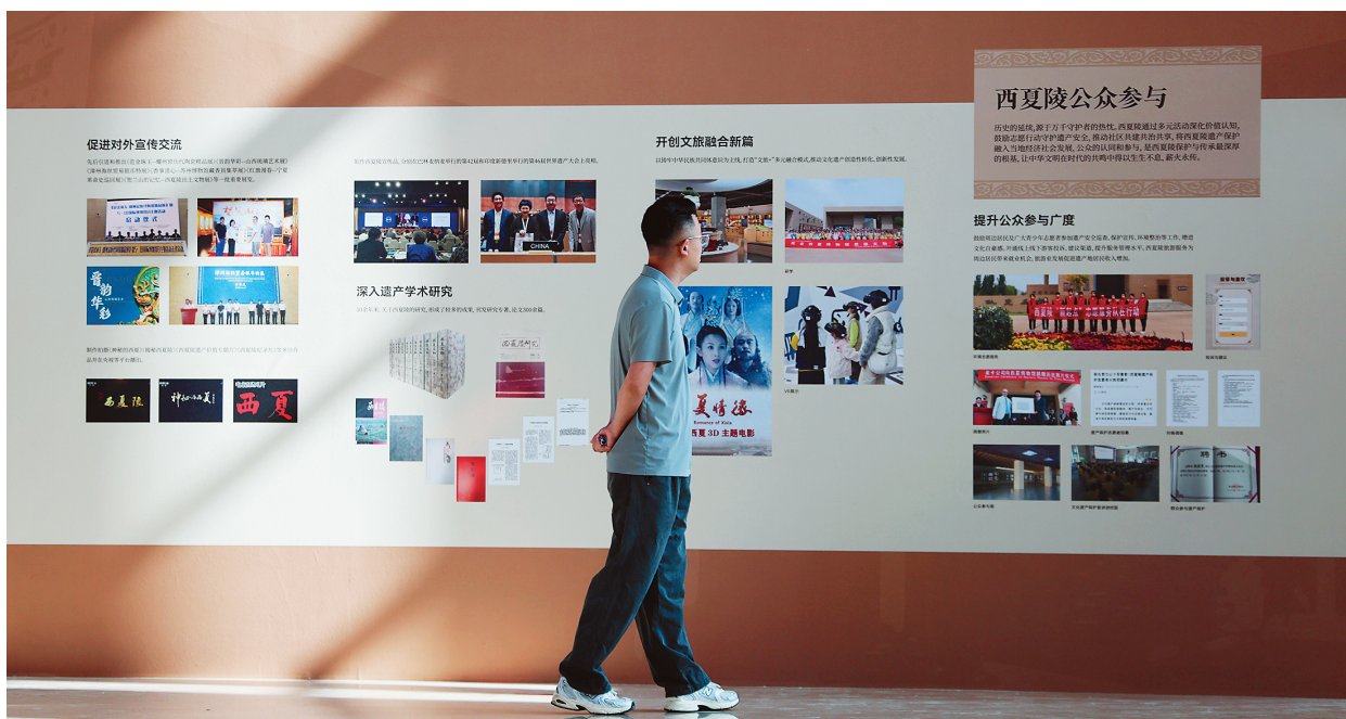
2025年7月14日,“世界文化遗产——西夏陵”展览在银川市民大厅开展。