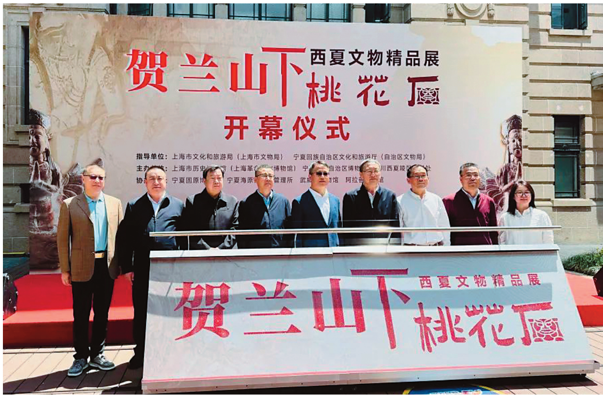
2025年4月29日，“贺兰山下‘桃花石’——西夏文物精品展”在上海市历史博物馆开展。

“西夏人用西夏文翻译了一大批汉文典籍，包括儒经、兵书、医书、史书、童蒙读本等，遍及汉文典籍中的精华，足见西夏的知识分子所接受的教育，也是以儒家经典为代表的中华传统文化。”彭向前说。史料记载，西夏立国后，迅速在全国设立汉学，即儒学教育机构，传授儒家经典，系统推广儒学教育。儒家倡导的“仁政”“礼治”“忠孝”等理念，也是维系社会秩