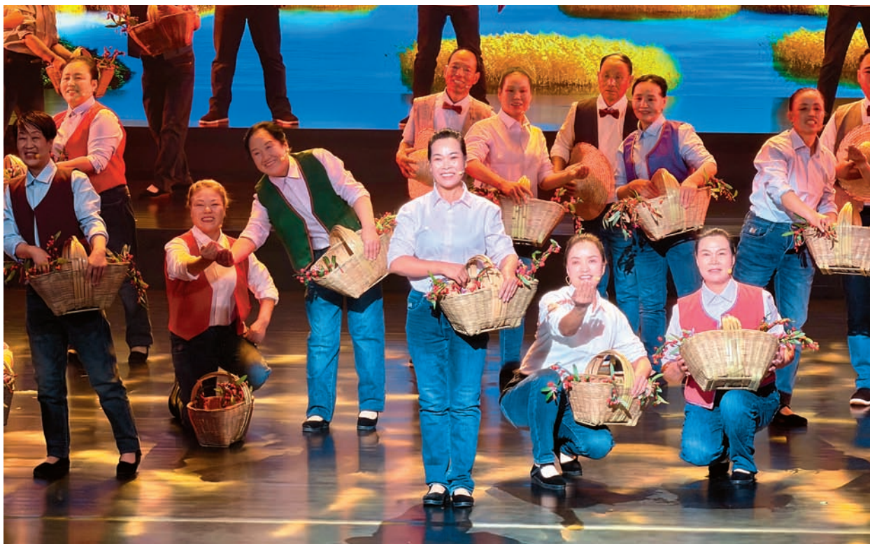
大战场镇红宝村农民合唱团在首届中国文明乡风大会的舞台上唱响《我们的故事,我们的歌》。

每当微信群里传来排练的“集合号”,周边红宝村、大战场村、长山头村、兴业村、庆丰社区的村民和居民,或开着汽车、农用三轮车,或骑着电动车,或三五成群步行,都奔向文化站,